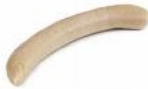
Bratwurststand am Sa und So