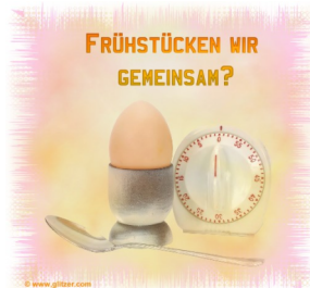
großes Sonntagsfrühstück mit frischen Brötchen, Kaffee und Tee sowie mit großem Obstbuffet