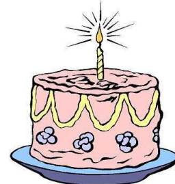
Kuchenbuffet, sowie Tee und Kaffee am Sa und So