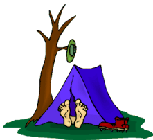
freies Zelten in abgeschlossener Anlage

Besondere Aktivitäten und Angebote sind: